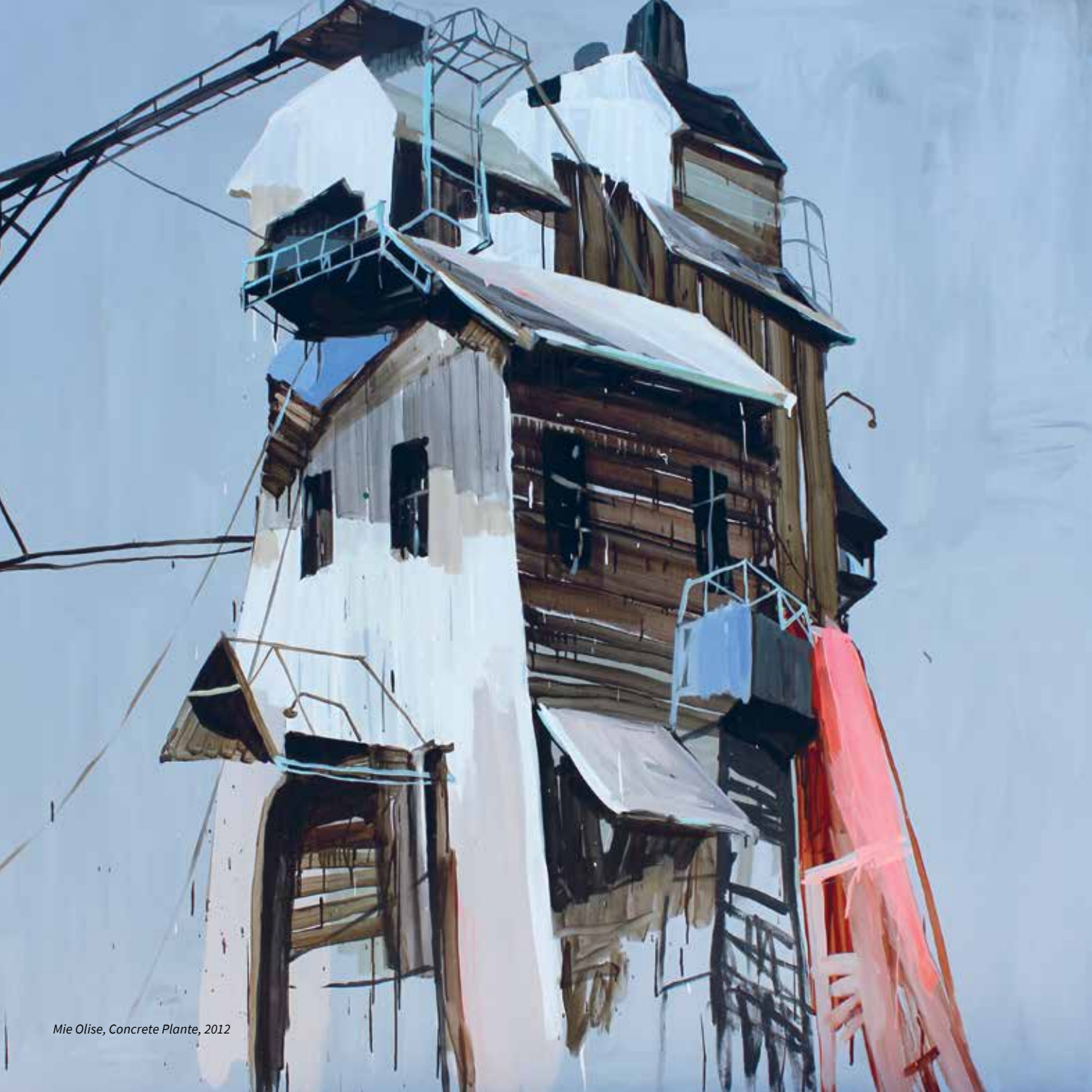
Mie Olise, Concrete Plante, 2012