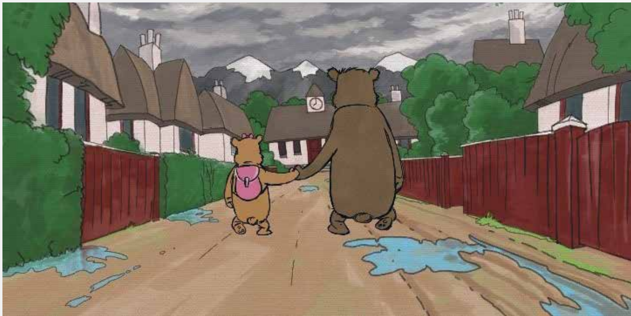
Still fra tegnefilmen

Et stort antal børn rammes hvert år af sorg. I dette undervisningsmateriale sættes der med udgangspunkt i seks nyproducerede tegnefilm fokus på, hvordan sorgen over at miste en forælder, at leve i en skilsmissecfamilie eller i en familie med misbrug, kronisk sygdom eller manglende tilstedeværelse kan opleves.