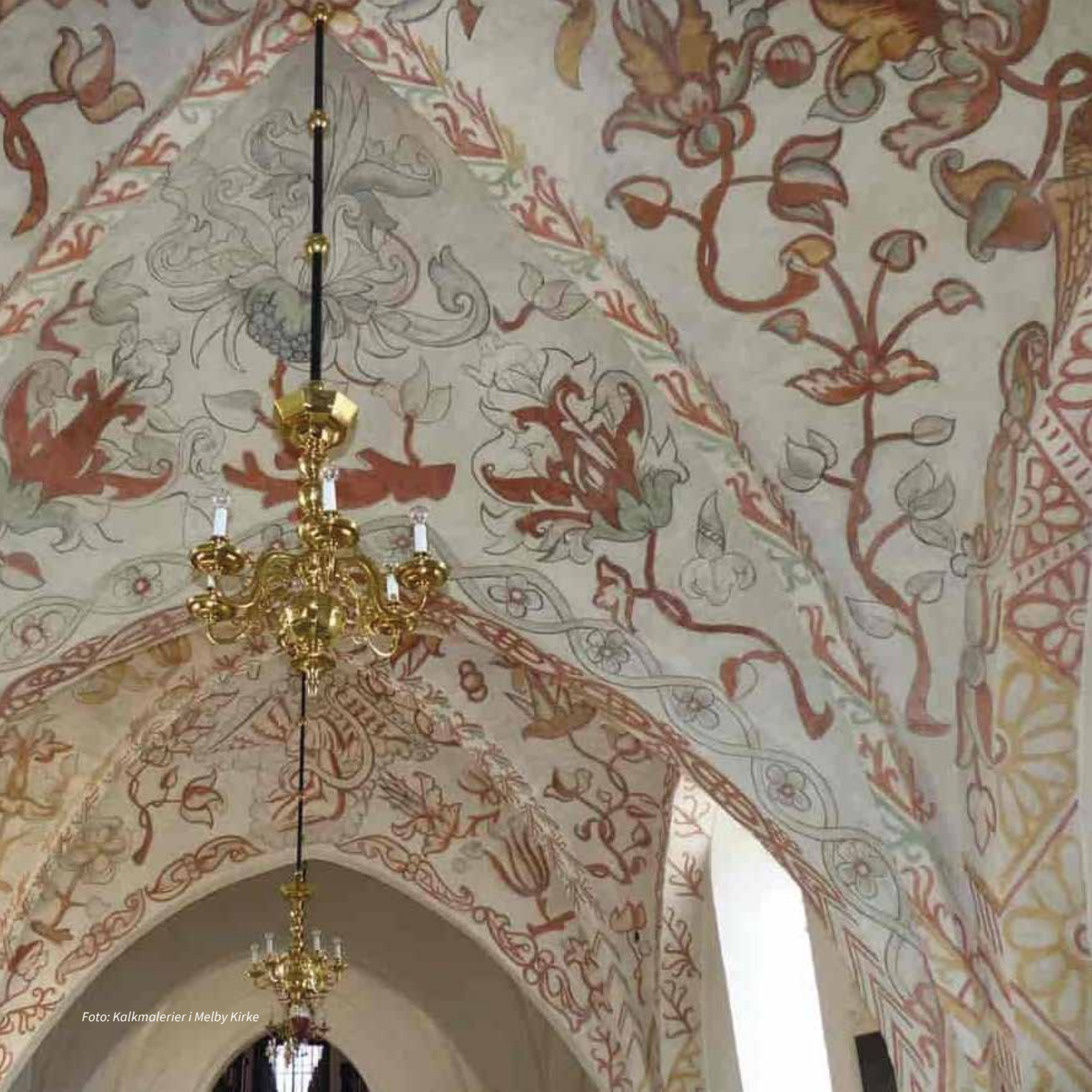
Foto: Kalkmalerier i Melby Kirke