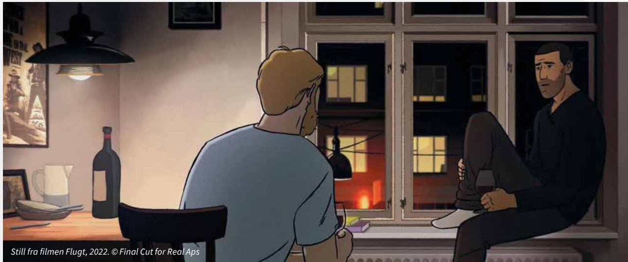
Still fra filmen Flugt , 2022.

ET PROJEKT MED AFSÆT I DEN OSCARNOMINEREDE ANIMEREDE DOKUMENTARFILM