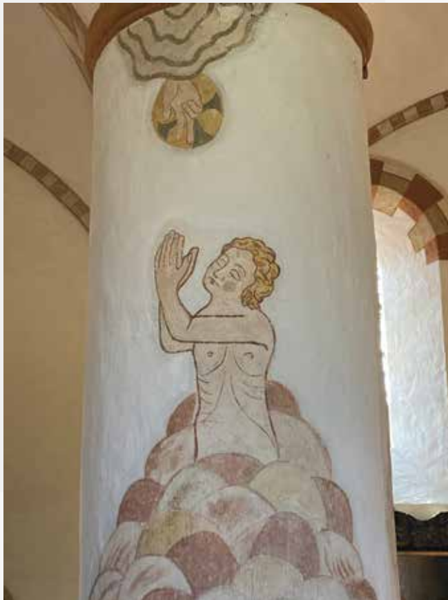
Foto: Kalkmaleri fra Søborg Kirke

Med undervisningsmaterialet får læreren hjælp til at udfolde filmens historier og pointer. Først introduceres eleverne overordnet til kalkmalerier og deres samtid middelalderen. Dernæst findes fem forslag til fordybelsesområder, hvor eleverne vil arbejde med Bibelens kronologi, udvalgte bibelhistorier og nøgler til at "åbne" kalkmaleriernes hemmeligheder. Som afslutning på projektet skal eleverne selv prøve kræfter med at skabe film.