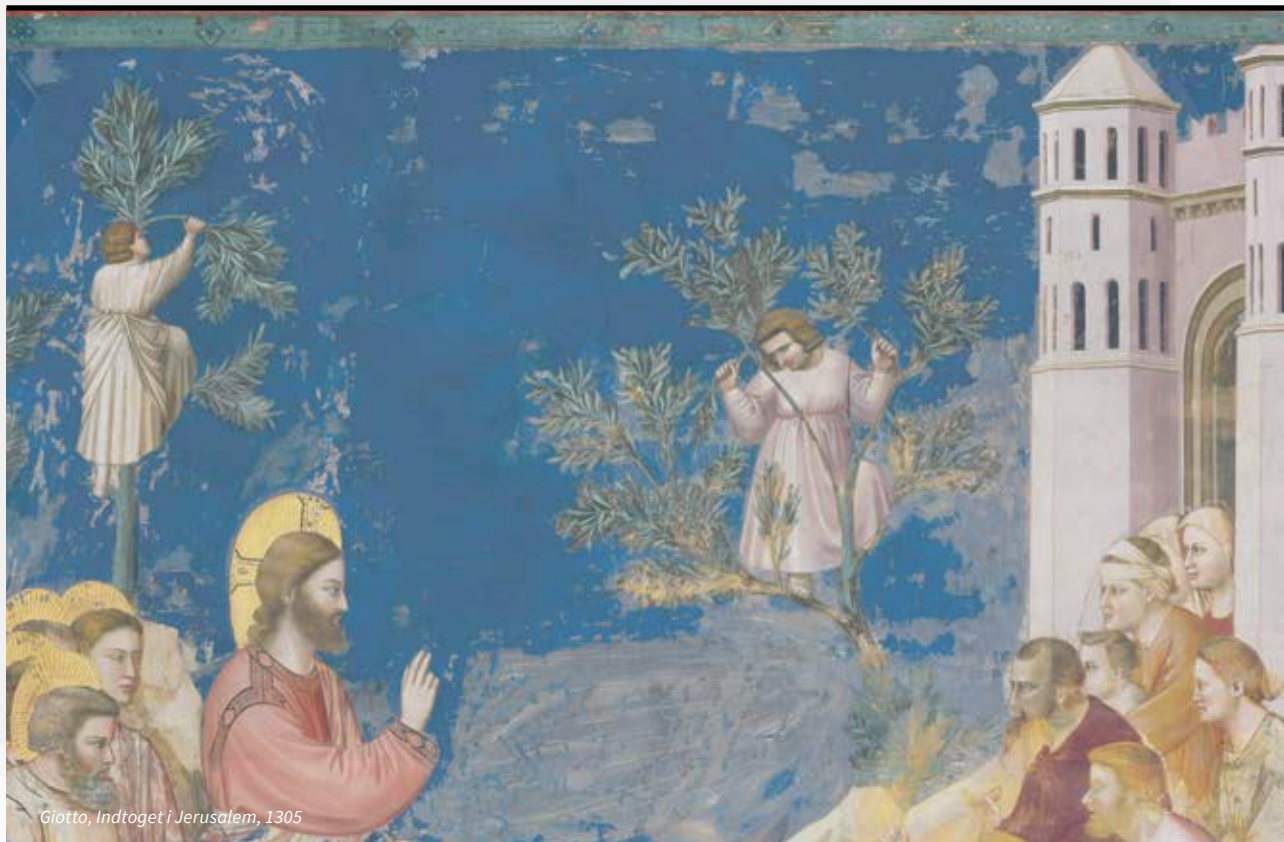
Giotto, Indtoget i Jerusalem, 1305

Undervisningsmaterialet består af en hjemmeside, som eleverne kan arbejde med gennem billeder og tekster. Hjemmesiden giver overblik over påskens begivenheder og centrale bibelfortællinger gennem en række kunstbilleder fra Palmesøndag, skærtorsdag,