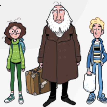
Illustration: Jan Solheim, 2022

Et gennemgående element i projektet er at understøtte elevernes historiske bevidsthed. Det gøres via en kuffert, som indeholder genstande fra en grundtvigsk arv; en salmebog, en stemmeseddel og en fortælling fra nordisk mytologi. I samme kuffert skal eleverne give Grundtvig noget tilbage, som karakteriserer deres liv og fællesskab med hinanden i nutidens samfund. Formålet er, at eleverne får et elementært kendskab til Grundtvig og hans betydning for det samfund, som eleverne lever i.