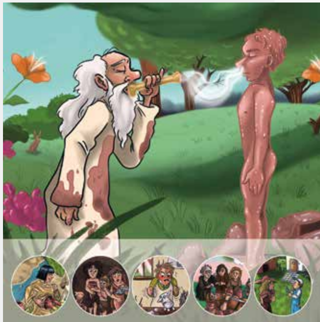
Illustration: Nina Arrocha

Undervejs i arbejdet med fortællingerne skal eleverne selv skabe væsener ud af ler og afprøve forskellige metoder og teknikker, som fremkalder personlighed og karakter. Elevernes væsener bruges som brikker i det afsluttende, evaluerende spil.