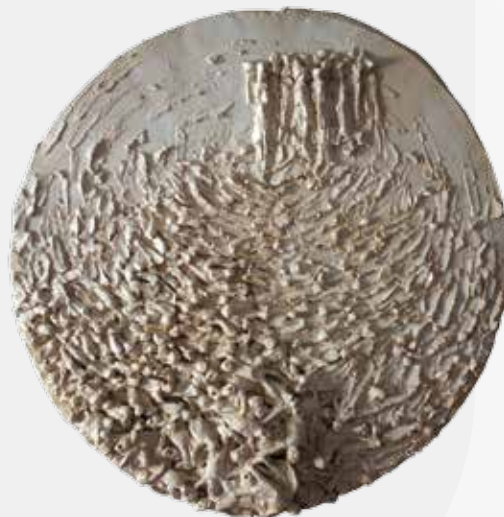
Jørgen Haugen Sørensen, Den store tanke, 2016