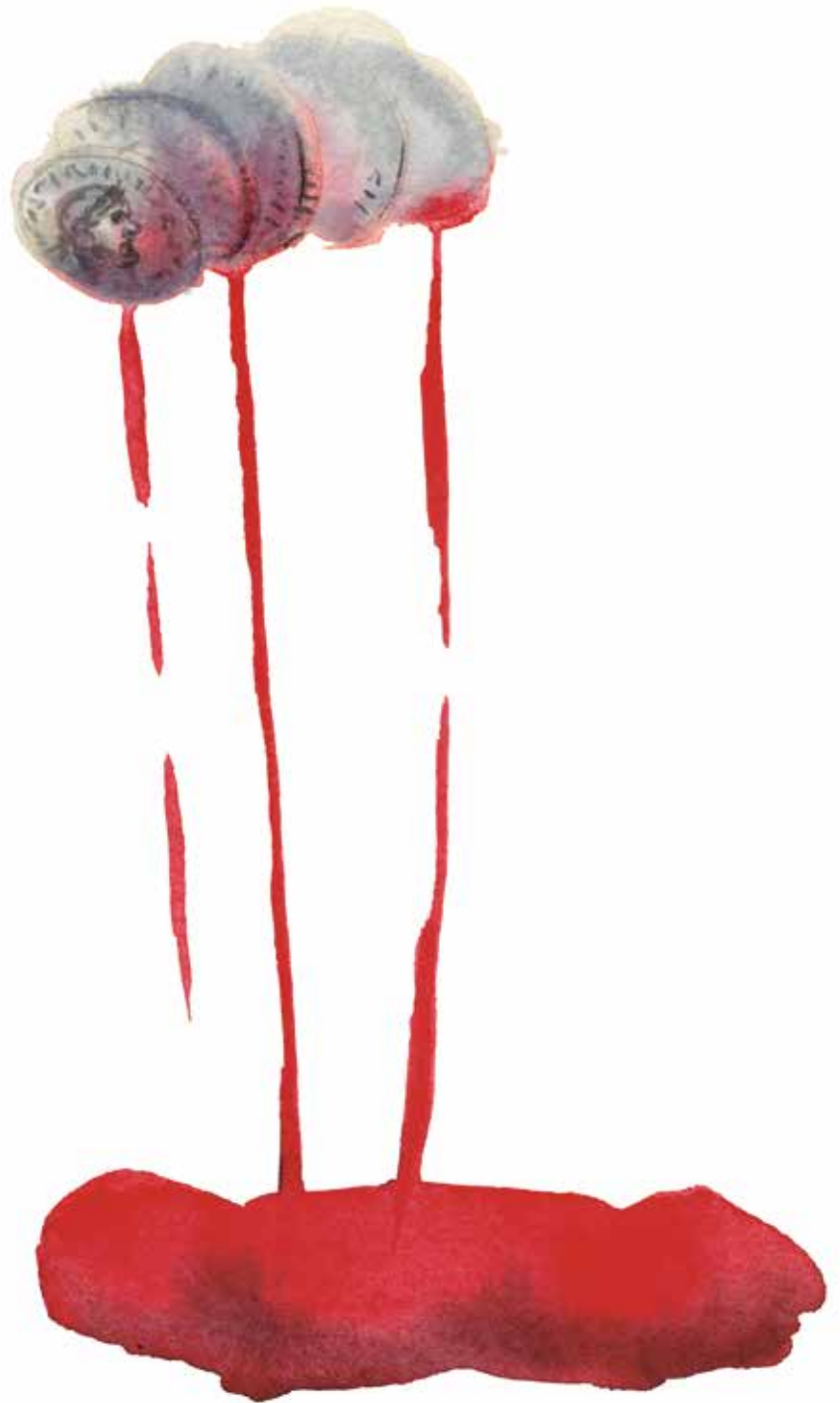
Illustration af Hanne Bartholin fra Bibelhistorier af Ida Jessen og Hanne Bartholin, Bibelselskabets Forlag 2016