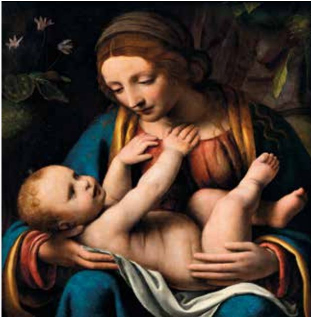
Bernardino Luini, Madonna med kristusbarnet , 1515-1525, Nivaagaards Malerisamling

Jesus voksede ifølge Bibelen op med en far i himlen og en papfar ved hånden, men han blev født af en helt