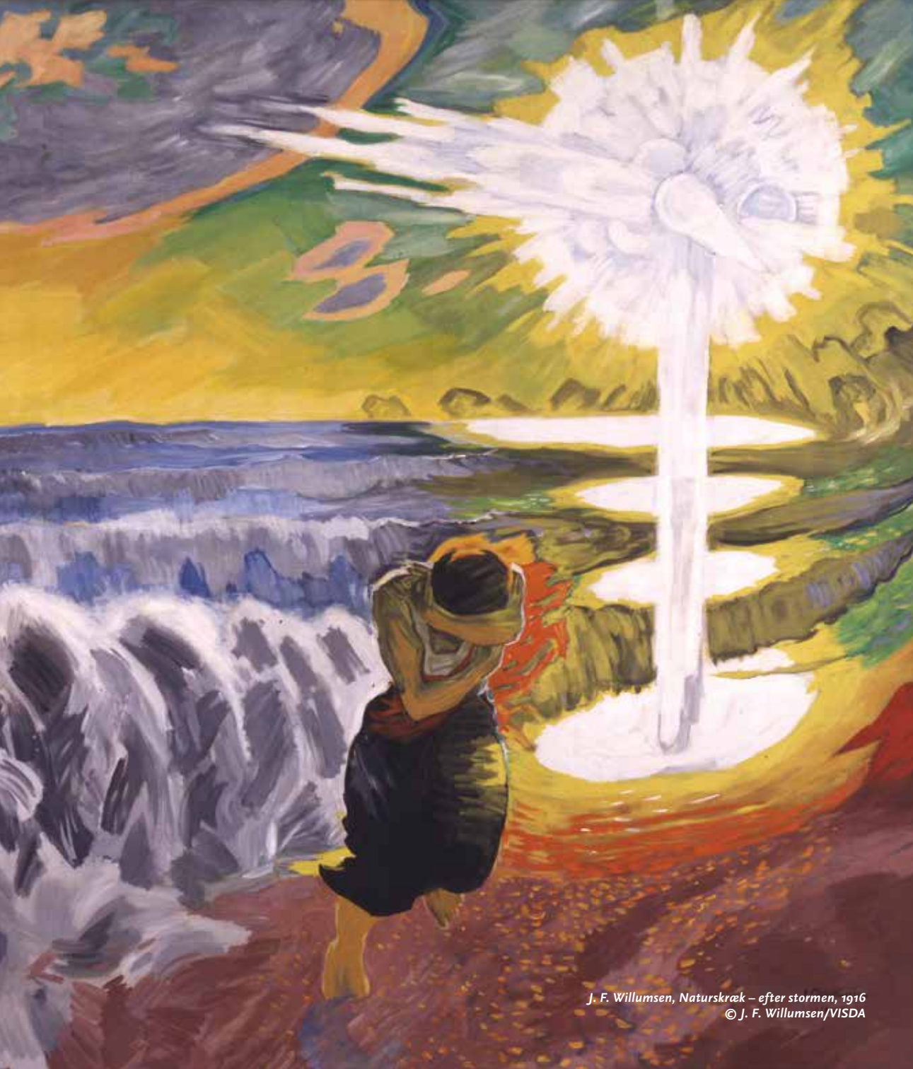
J. F. Willumsen, Naturskræk - efter stormen , 1916 © J. F. Willumsen/VISDA