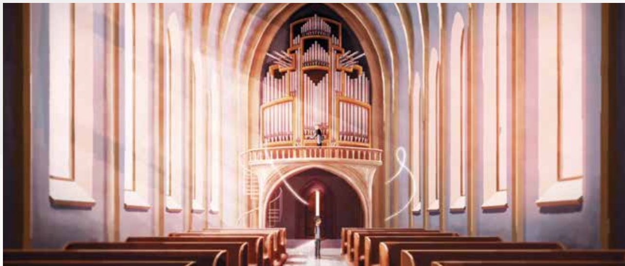
Still fra filmen Lydbølge , 2015

Til projektet er udviklet en IT-plattform, hvor eleverne online sampler deres egen musikfortælling af effektlyde og stumper af orgelmusik. Desuden indgår der i projektet en animationsfilm, der tematiserer de eksistentielle spørgsmål gennem musik og lyd.