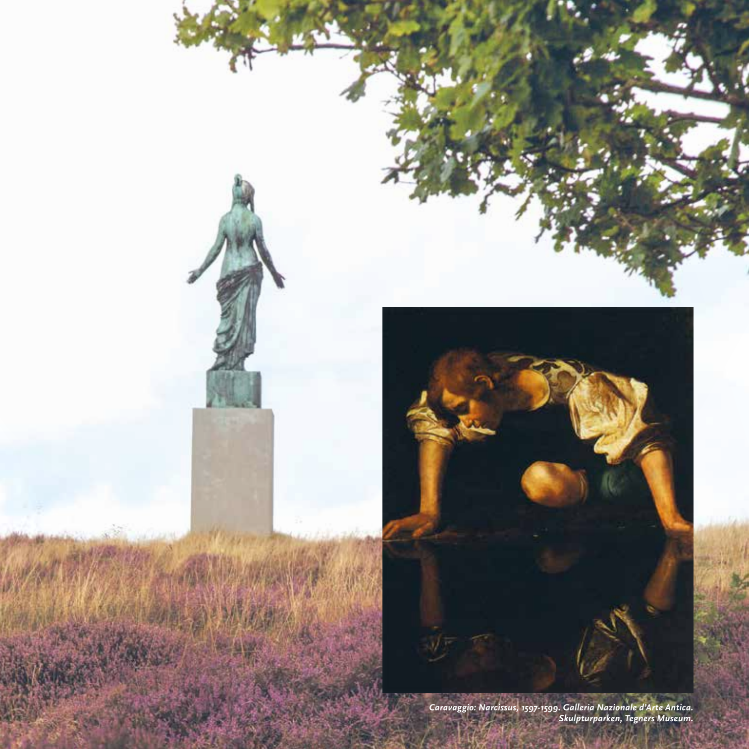
Caravaggio: Narcissus, 1597-1599. Galleria Nazionale d'Arte Antica, Skulpturparken, Tegners Museum.