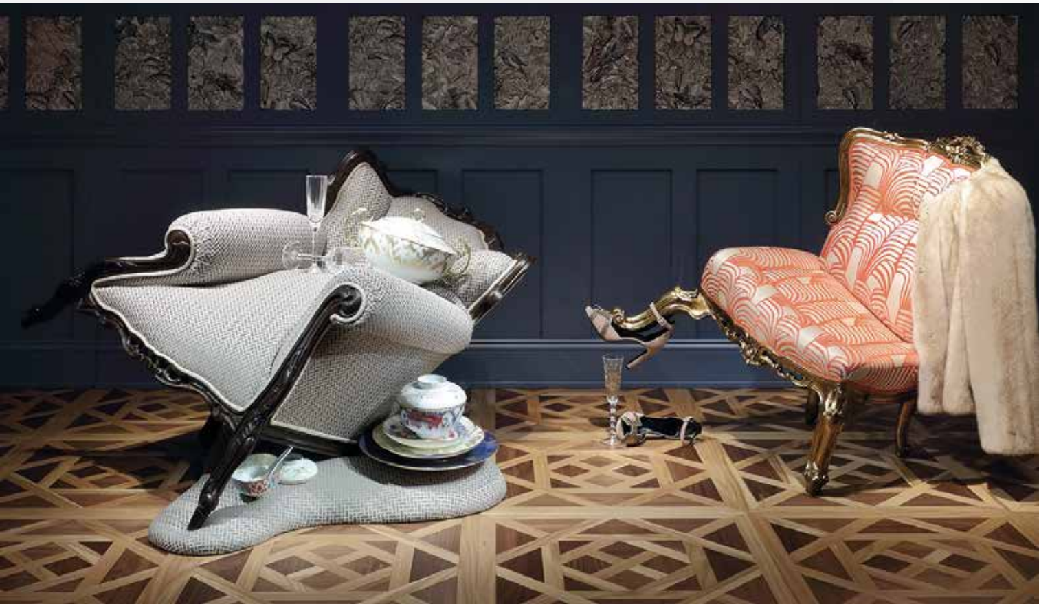
Nina Saunders, Gretha's Party, © Nina Saunders/VISDA